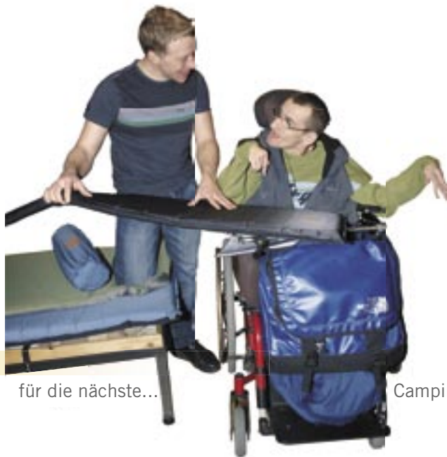
für die nächste...